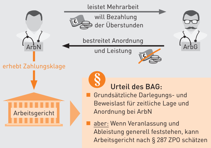
Grafik: IWW Institut